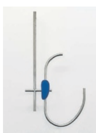
Obra de la serie Flat Bones.