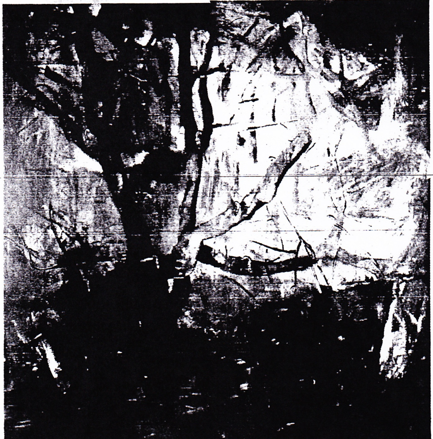
▶ Invierno, 1990 Oleo sobre tela 183 x 172.3 cm