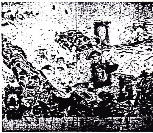
◀ Tiempo y Espacio en Negativo, 1990 Oleo sobre tela 264 x 320 cm