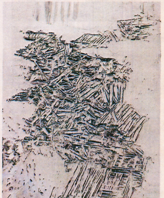
Rubble #12, 2008 Las vistas aéreas de ciudades en ruinas son el sello de Rubble.