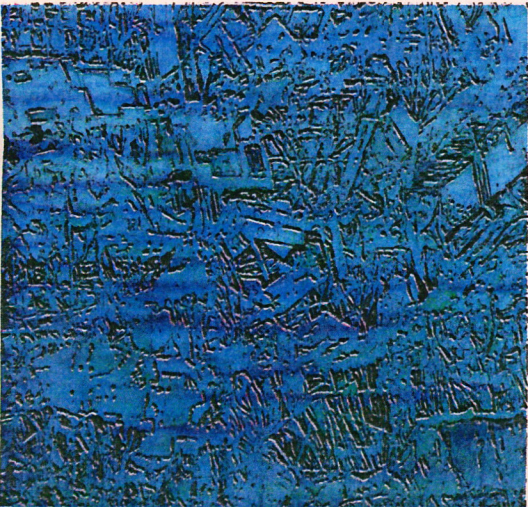
Rubble #8, 2007 Combina gasa y anilina para obtener superficies frágiles.