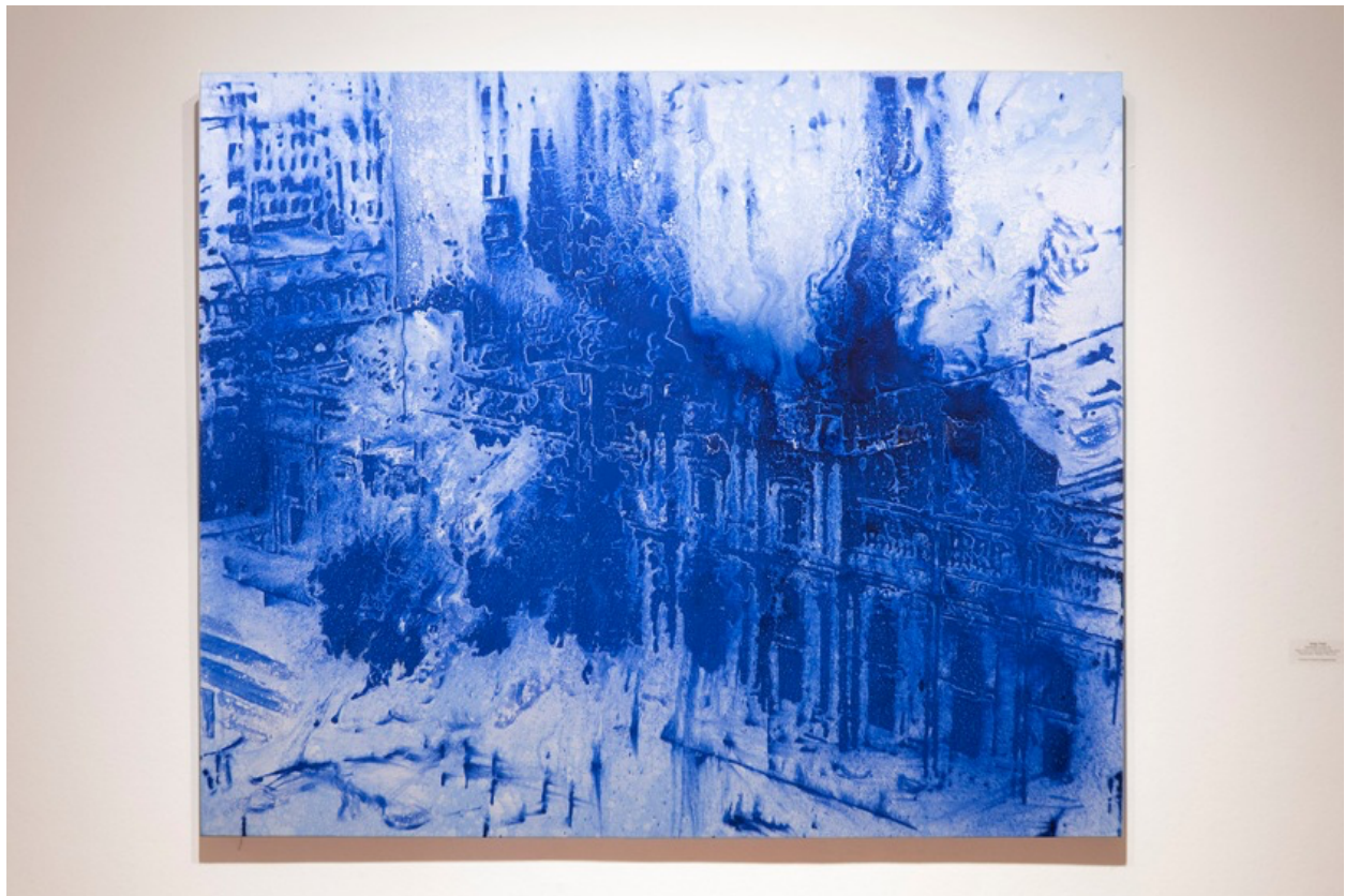
Imagen destacada corresponde a la obra de Jorge Tacla.

Organizada por la agencia González y González, la exposición está dedicada a la memoria del crítico de arte Guillermo Machuca (1961-2020) , quién fuera cómplice y un estrecho colaborador del proyecto y espacio de exhibición González y González (2010-2014) durante sus años de vida en el centro de Santiago. Por su humor, inteligencia y amistad.