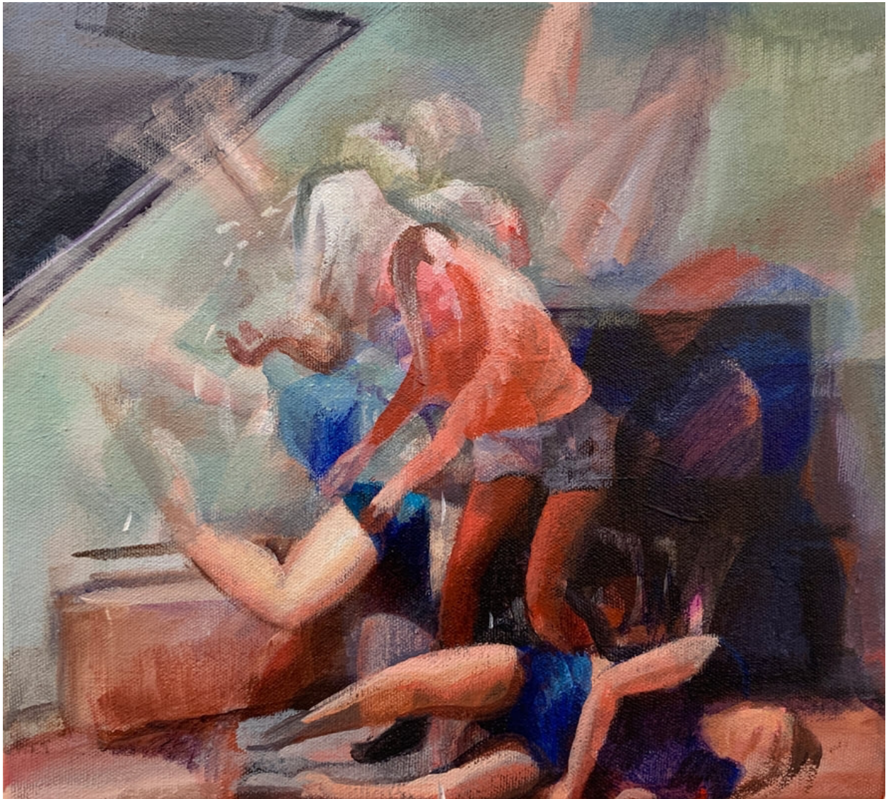
Claudia Bitrán, Ask what time it is , 2020, acrílico sobre tela, 25,5 x 28 cm.

Siguiendo su metodología de pintar y fotografiar a partes iguales, como se observó en sus dos más recientes exposiciones Frenzy (2020) y Fallen (2021), la artista comienza con un escenario pintado sobre lienzo, fotografía esta etapa terminada, para luego volver a pintar encima. Lo hace sucesivas veces hasta que completa la pintura. Cada una de las fotos, al ser superpuestas como en los storyboards de las historietas animadas, se convierten en un videoclip en movimiento. Bitrán llama a este proceso “Stop-Motion-Painting-Animation”, algo así como “pintura animada cuadro por cuadro”.